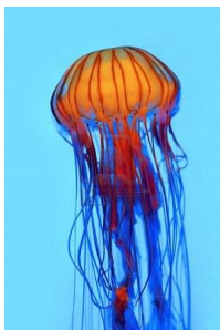
Photos de méduses libres de droits

Cliquer sur les photos pour suivre le lien